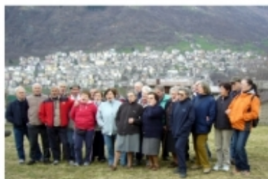
Museo etnografico di Premana Formato CD wav anno 2012