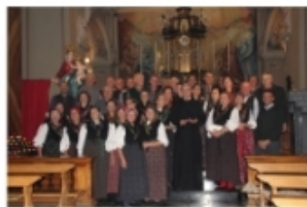
Vesperi in latino Chiesa s.Dionigi Premana 14-10-2012